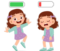
Over grenzen gaan met vermoeidheid als gevolg